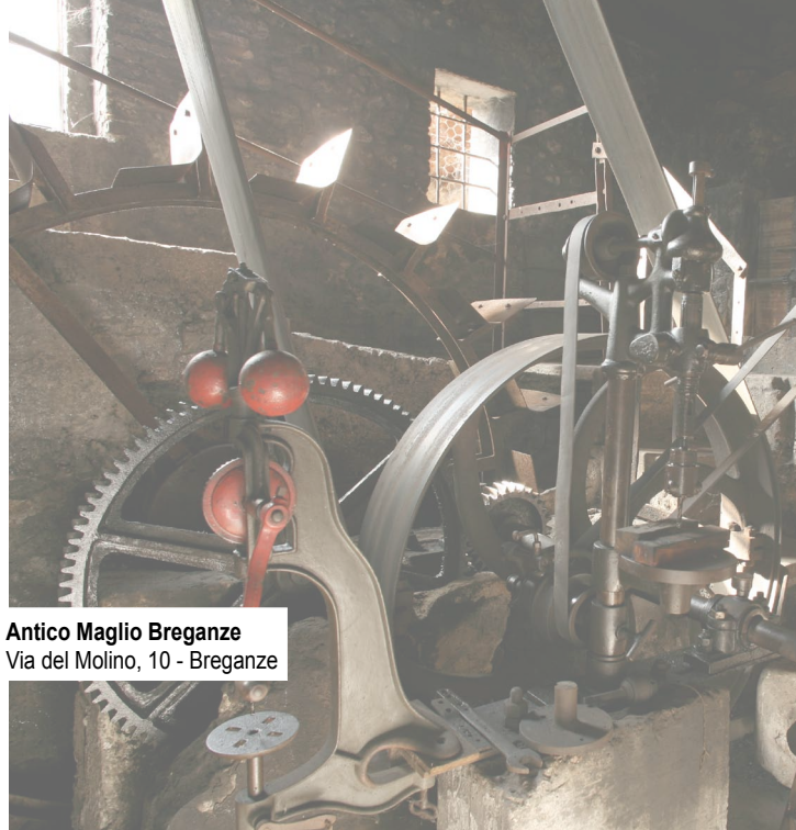
Antico Maglio Breganze Via del Molino, 10 - Breganze

Seguirà un momento conviviale a cura della "Ciacola" con i vini del Consorzio Tutela Vini DOC Breganze.